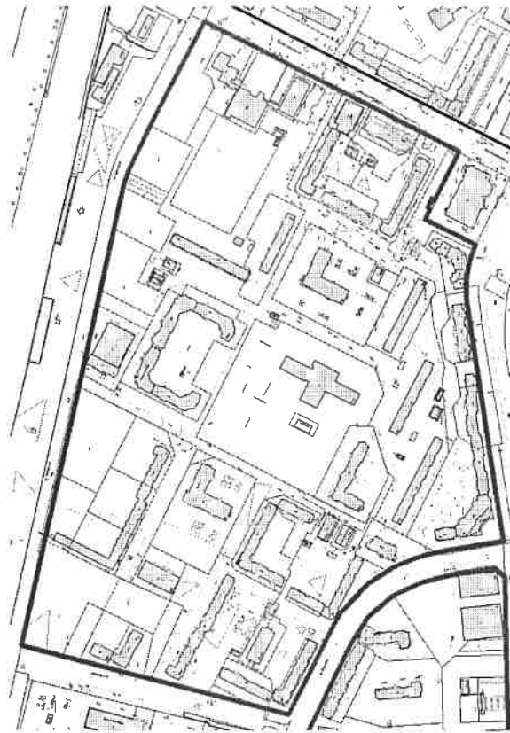
СХЕМА границ проектирования

к заданию на подготовку документации по планировке территории муниципального образования "Город Архангельск" в границах прот. Московского, ул. Стрелковой, ул. Карлоторгской и ул. Прокопия Галушина площадью 37,5503 га